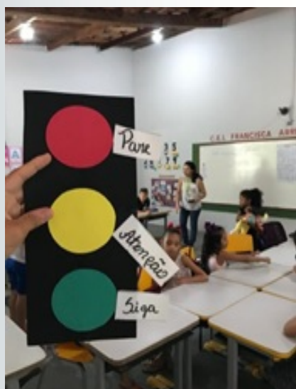
Material utilizado, abordando o conhecimento das crianças sobre o semáforo.