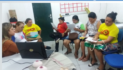
As participantes lendo Termo de Consentimento Livre e Esclarecido (TCLE) na primeira oficina.