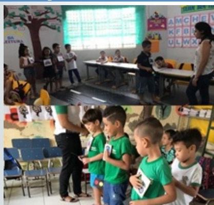
Aplicação da última atividade nas duas creches em Acarape e Redenção (CE).