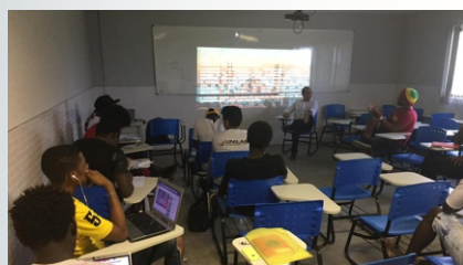
Estudantes participam ativamente das atividades, com intervenções pertinentes e bem fundamentadas.