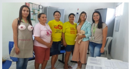
Segunda oficina prática, realizada na Unidade Básica de Saúde em Acarape (CE).

A presente atividade de extensão tem como foco a capacitação dos agentes comunitários de saúde de Acarape (CE) sobre aleitamento materno. A primeira fase foi constituída por reuniões com os gestores da saúde (secretário de saúde e coordenadores das unidades básicas de saúde) para apresentação do projeto e agendamento dos melhores dias e horários para a execução das ações educativas com o público-alvo.