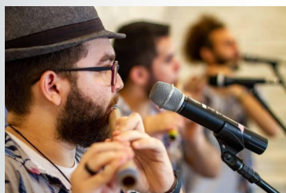
O projeto mantém viva a tradição das bandas cabaçais do Ceará.