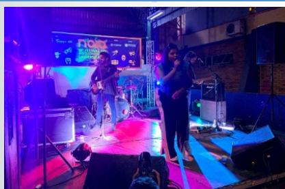
O 18º Festival do Audiovisual Universitário foi incluso na Rota das Culturas.