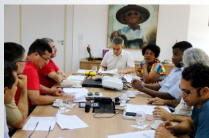
Articulação e planejamento em conjunto com a Secretaria de Cultura do Ceará.