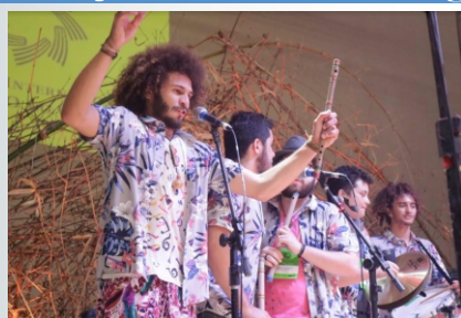
A Banda Cabaçal Palmares em apresentação na Bienal do Livro do Ceará, em 2019.