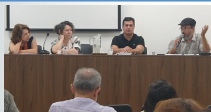
Equipe do projeto presente na abertura do semestre letivo do PPGS/UECE, no Auditório do CESA/UECE.