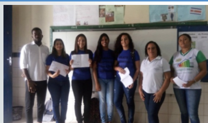
Apresentação do projeto na EEFM São Francisco - Guaiúba (CE).