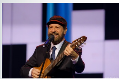
Cantor João Bosco se apresenta no projeto MPB em Movimento, evento incluso na Rota das Culturas.

Dando prosseguimento às suas atividades em 2020, o projeto Rota das Culturas articulou para que os estudantes da Unilab participassem de mais 2 eventos: o NOIA e o MPB em Movimento, ambos ocorridos em Fortaleza.