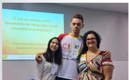
O mini-curso foi oriundo do projeto 'EMPATIA: Promoção da ética e da polidez nas práticas profissionais'.

Vivemos em um contexto histórico e social, onde se privilegiam mais os conhecimentos técnico e científico que as relações humanas, levando muitas vezes a realização de práticas laborais que mais enfraquecem os laços sociais do que os fortalecem. Este minicurso surge de um projeto de extensão chamado EMPATIA: Promoção da ética e da polidez nas práticas profissionais (PIBEAC 2020), e com ele pretendemos lançar mão dos estudos da polidez linguística e da comunicação não violenta (CNV) para o desenvolvimento da capacitação de profissionais e estudantes da educação para o aperfeiçoamento de suas atividades de integração dos estudantes em sala de aula. O minicurso demonstrará como prevenir, amenizar e evitar conflitos relacionais através do exercício da empatia e da polidez.