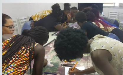
Oficina de Cartografia Social com mulheres guineenses, em parceria com o projeto de pesquisa “Estudantes, Direitos e Territórios Urbanos no Maciço de Baturité (CE).”