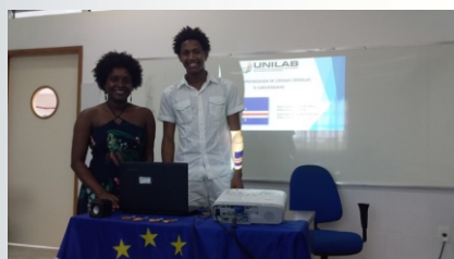
Apresentação oral do projeto durante a Semana Universitária da Unilab, no Campus dos Malês (BA).