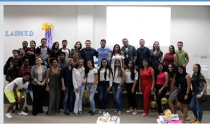
Integrantes da Liga Acadêmica de Segurança Medicamentosa da Unilab (LASMED).