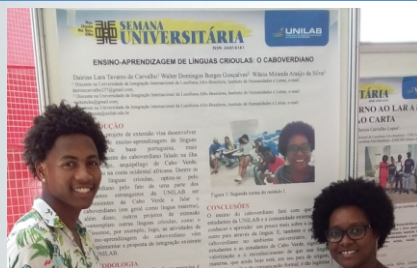
Apresentação de poster do projeto durante a Semana Universitária da Unilab, no Campus dos Malês (BA).