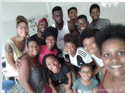
Participantes da oficina ministrada pelo projeto, durante a Semana Universitária, no Campus dos Malês (BA).