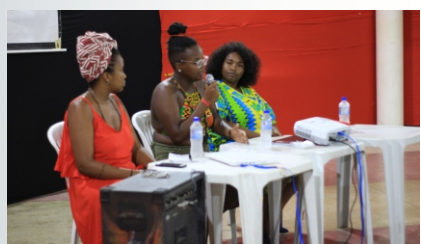
Rodas de conversa fizeram parte da III Mostra Ousmane Sembene de Cinema.