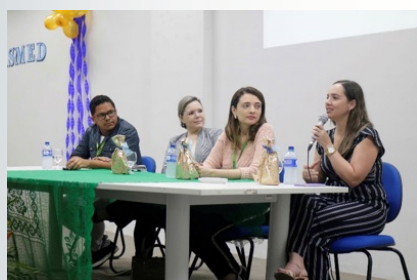
Mesa de lançamento da Liga Acadêmica de Segurança Medicamentosa da Unilab (LASMED).