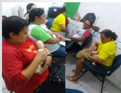
Técnica de amamentação sendo apresentada às participantes das oficinas.