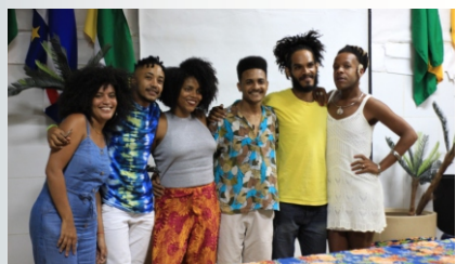
Diversidade, sexualidade e transgeridade no audiovisual foram alguns dos temas abordados na Mostra.

Entre os dias 4 e 8 de dezembro de 2019 o Cinemalês realizou a III Mostra Ousmane Sembene de Cinema, que foi realizado no Campus do Malês e no Mercado Cultural de São Francisco do Conde. A MOSC recebeu diversos produtores, diretores e pesquisadores do cinema africano e afro-diaspórico que fizeram parte da programação com oficinas, roda de conversa e sessões temáticas. A programação também contou com a exibição do filme “Downpression” também realizado pelo Cinemalês e contou com a participação da equipe do curta-metragem falando sobre diversidade, sexualidade e transgeridade no audiovisual. Para conferir um pouco do que aconteceu na III MOSC é só acessar as redes sociais do projeto e conferir um pouco do que rolou.