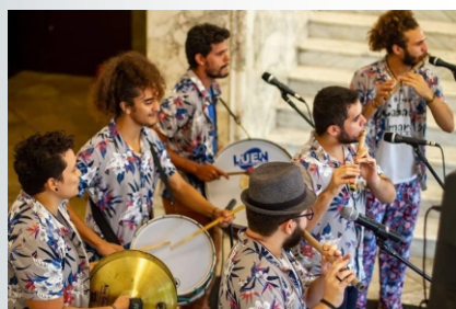
Para além das apresentações dentro e fora da Unilab, o projeto promove debates, oficinas e outras atividades.

O projeto Cria do Mundo: salvaguarda, valorização e difusão das bandas cabaçais do Nordeste e o grupo Banda Cabaçal Palmares é uma continuidade das ações da banda Cabaçal formada no contexto da Unilab, que tem como inspiração a Banda Cabaçal dos Irmãos Aniceto, radicada no Crato, região do Cariri, Ceará.