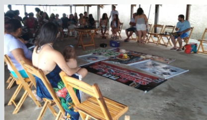
Participação no Encontro de PMA (Planejamento, Monitoramento e Avaliação) da Rede DLIS do Grande Bom Jardim.