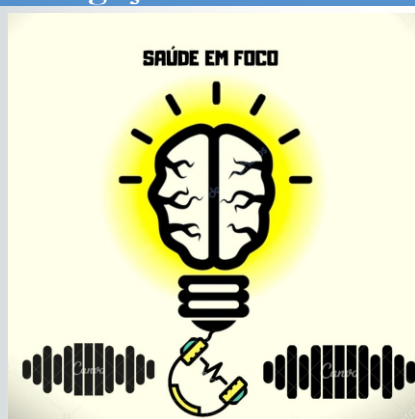
Logotipo provisório do Projeto, que será exibido enquanto o podcast estiver tocando.