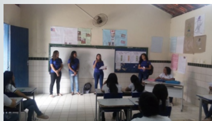
Apresentação do projeto na EEFM São Francisco - Guaiúba (CE).

O projeto ContraCena: praça de teatro e leituras dramáticas, coordenado a partir do curso de Letras - Língua Portuguesa, propõe em suas ações colaborar com apresentações tanto em escolas, como em espaços coletivos e públicos dos municípios do Maciço de Baturité, assim como em espaços acadêmicos da região, através de atividades interdisciplinares nos campos da literatura e teatro, tendo por base textos de gêneros teatrais de autores africanos.