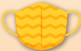
Máscara de pano

As máscaras de tecido protegem pouco contra a variante Ômicron. Caso precise utilizá-las, opte por aquelas que possuem três camadas de tecido (sendo a cama externa de 100% algodão ou poliéster, a do meio de TNT e a interna de algodão) e que fiquem bem ajustadas ao rosto. Máscaras frouxas reduzem substancialmente a sua proteção.