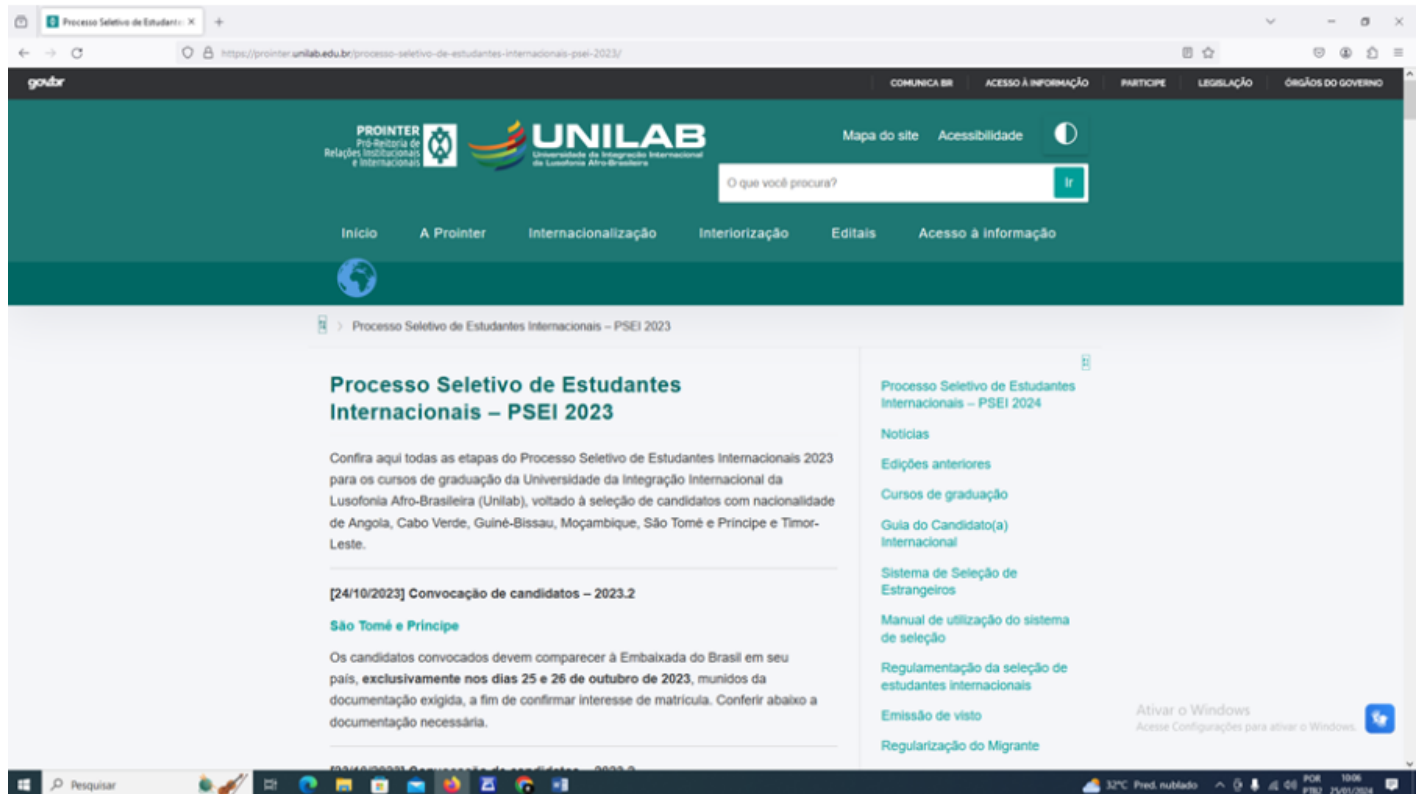
Imagem 01: Processo seletivo de estudantes internacionais